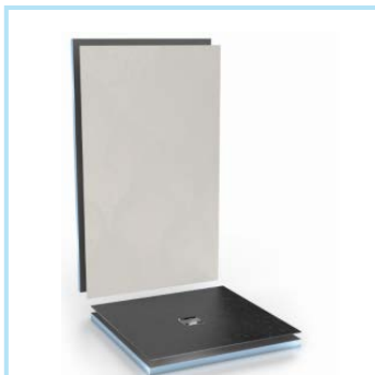
Einfach TOP – in Theorie und Praxis

... die wedi Fundo Top und Top Wall sind Designoberflächen der neuesten Generation!