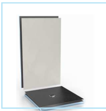
Einfach TOP – in Theorie und Praxis

... die wedi Fundo Top und Top Wall sind Designoberflächen der neuesten Generation!